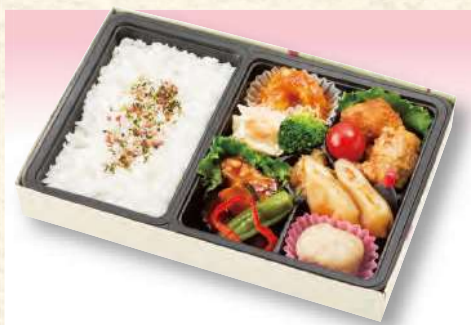
No. 609 中華風弁当 27.6×18.2cm 1,210円(税込)