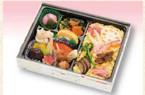
No. 610 季節の ちらし寿司弁当 21.6×16.5cm 1,210円(税込)