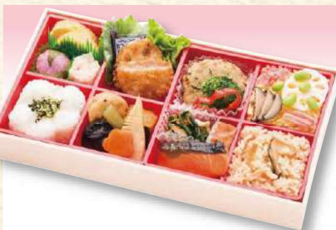
No. 606 すみれ 30.0×16.0cm 1,430円(税込)