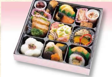
No. 603 花こもん 25.0×25.0cm 1,540円(税込)