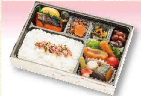
No. 611 和風弁当 24.2×16.5cm 1,045円(税込)