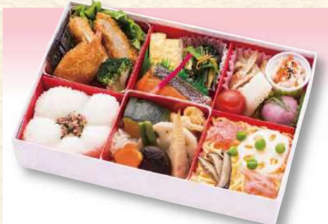
No. 601 花かすり 25.0×17.0cm 1,760円(税込)