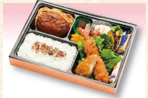
No. 608 洋風 幕の内弁当 27.5×19.0cm 1,210円(税込)