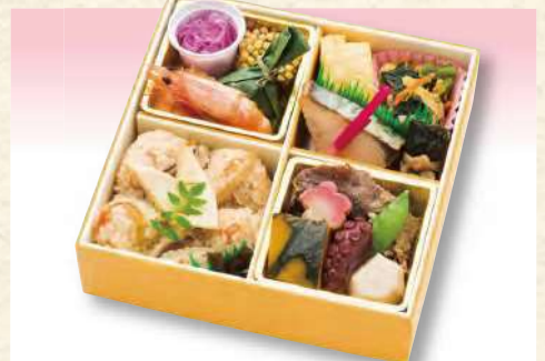
No. 602 季節の 松花堂弁当 17.5×17.5cm 1,760円(税込)