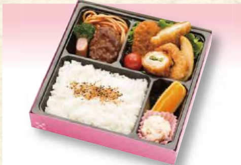
No. 612 洋風弁当 21.4×21.4cm 1,045円(税込)