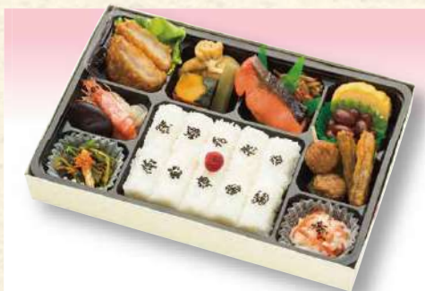
No. 607 幕の内弁当 27.6×18.2cm 1,210円(税込)