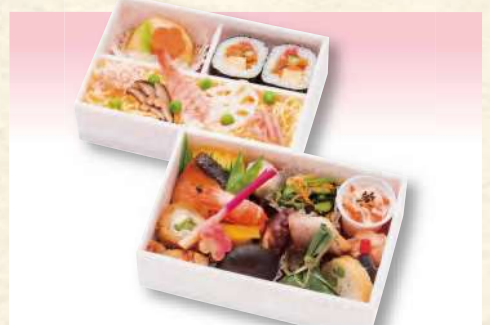
No. 627 みやび 17.0×11.3cm 2,310円(税込)